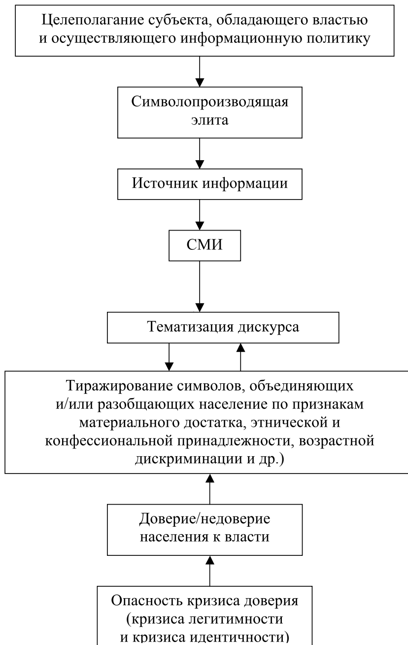
Рис. 1. Экспертная диагностика информационной среды в целях разработки способов социального оздоровления