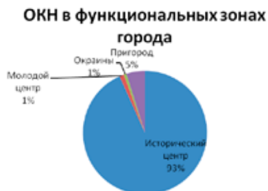
Рис. 1. Доли недвижимых ОКН в функциональных зонах Калуги исходя из сводного перечня

Но предметная среда пригорода по сравнению с внутренним городом более разрежена. Различный уровень насыщенности городского пространства мнемическими объектами следует оценивать не через абсолютную численность, а по удельному весу ОКН в составе гражданской застройки или через отношение их количества к площади территории. Важна и насыщенность повседневно-бытового (непубличного) пространства мнемическими объектами, которую выражает количественное доминирование в составе зданий — ОКН памятников жилой архитектуры или выполняющих жилые функции.